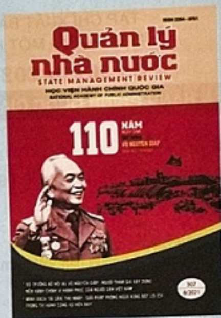
Bìa 1: Kỷ niệm 110 năm Ngày sinh Đại tướng Võ Nguyên Giáp.